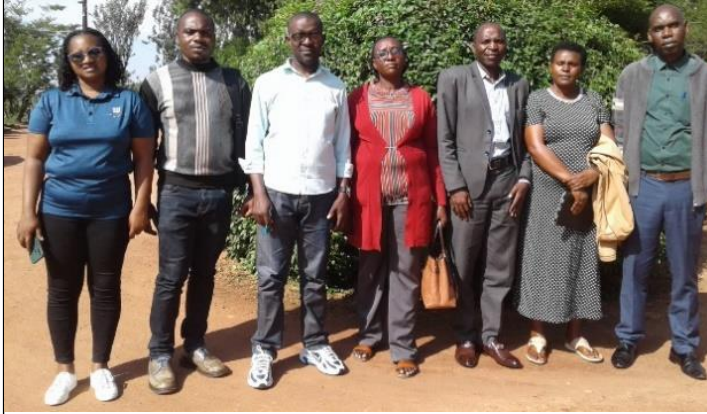
Le nouveau comité de jumelage rwandais