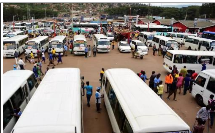
Stade de Nyamirambo à Kigali, mi-mars : des cars attendent les élèves, internes dans des secteurs parfois éloignés, pour les ramener dans leur famille

Ainsi il a été déconseillé de faire des voyages importants pour se protéger car il est facile que, dans le bus, une personne infectée peut contaminer les autres. A noter que le primordial est de se laver souvent les mains avec de l'eau propre [photo] et les désinfectants et éviter de marcher dans des foules. La semaine suivante, le nombre des cas infecté s'est augmenté. Bien sûr, les gens que ces personnes identifiées avaient rencontrés étaient aussi nombreux. Les mesures de 'lockdown' ont été prises pour deux semaines.