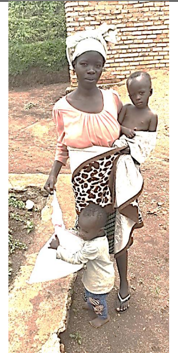
RIMMAP : les 'grands' apprécient le sac de sosoma