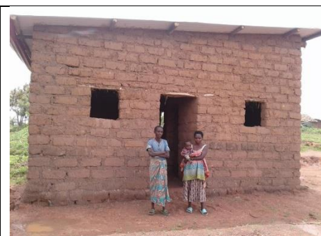
Maison de Perpétue, achevée (Kiruhura)