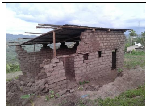
Maison d'Appolinarie, sinistrée (Gafumba)

Les questions d'environnement ont d'autres conséquences. D'abord, les maisons sont faites en briques adobé (boue séchée au soleil) avec une couche de ciment protectrice, qui sont moins énergivores. Les briques cuites sont aujourd'hui un luxe pour beaucoup d'habitants, vu la rareté du bois et les nécessités environnementales. Mais avant leur cimentage, les maisons sont particulièrement sensibles aux pluies. C'est ce qui est arrivé fin octobre : dans le secteur Rusatira (après Kinazi en 2022), 1 des 3 maisons a été totalement sinistrée (photos), mais – ouf - les 2 autres ont mieux résisté (1 achevée et l'autre ½ achevée).