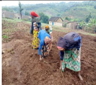
MAMA : plantation de manioc et d'arbres fruitiers

Plantation d'arbres fruitiers : pour manger plus de fruits et augmenter le revenu (110 avocatiers et 110 pruniers du Japon ont été distribués dans 2 groupes).