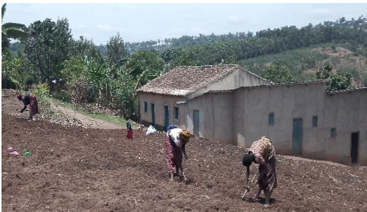
Récoltes d'octobre hélas faibles, car trop de soleil en été