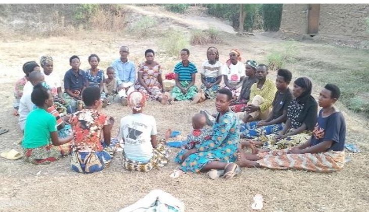
Suivi des tontines = épargne pour cultures, frais médicaux (les enfants accompagnent les mamans)