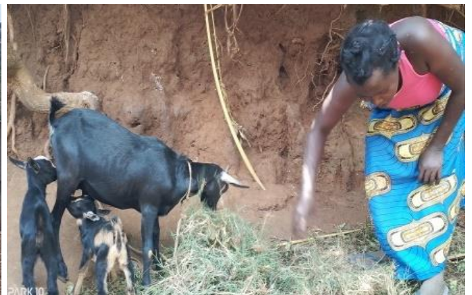
De 9 chèvres, déjà 5 chevreaux nés à Mugogwe