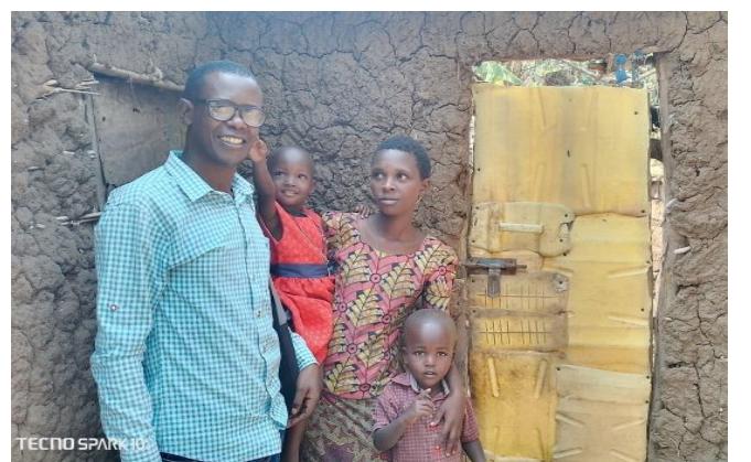
Visite à domicile des familles membres des MAMAs (murs en terre non cuite adobe, porte artisanale)