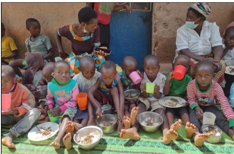
"tofu-party" avec le groupe MAMAs de Rusatira-Mugogwe (mamans d'enfants en sous-poids) (photo 30-5-2021)