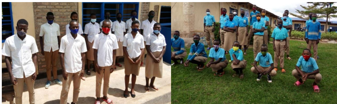
Photos des élèves soutenus des GS Kinazi et GS Maza.

Les écoles en collaboration avec le comité de jumelage ont sélectionné de nouveaux élèves en remplacement de ceux qui sont partis. Les nouveaux sont surtout ceux de la première année qui n'étaient pas capables de s'acquitter des frais scolaires.