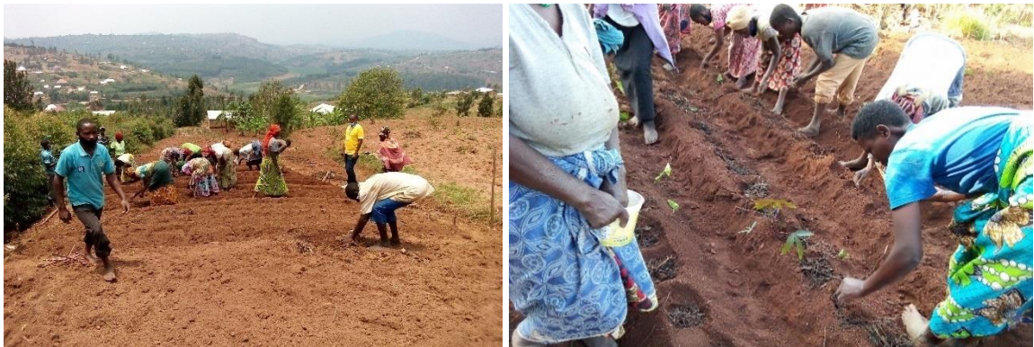
Les bénéficiaires sont en train d'installer des champs de démonstration des haricots

Ces groupements ont obtenu des semences de maïs et de haricot ainsi que des engrais minéraux utilisés dans la saison culturale. Ces intrants ont été distribués pour établir les champs de démonstration au niveau de chaque groupement.