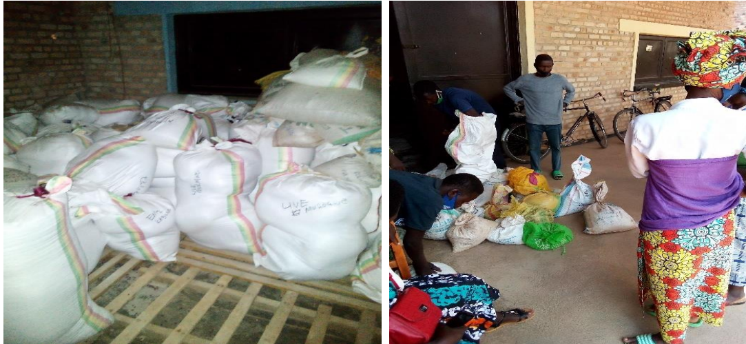
Stockage des semences dans le silo de Rusatira

Dans l'optique de pallier à l'insuffisance des semences et contribuer au respect du temps de semis, les bénéficiaires ont été mobilisés à adopter le système de conserver les semences localement produites. 3380 kg de haricots ont été conservés dans le silo localisé à Rusatira et par après à la fin du mois de septembre, ces semences ont été redistribuées aux bénéficiaires pour qu'ils puissent les utiliser comme semences dans leurs champs respectifs pendant la saison culturale.