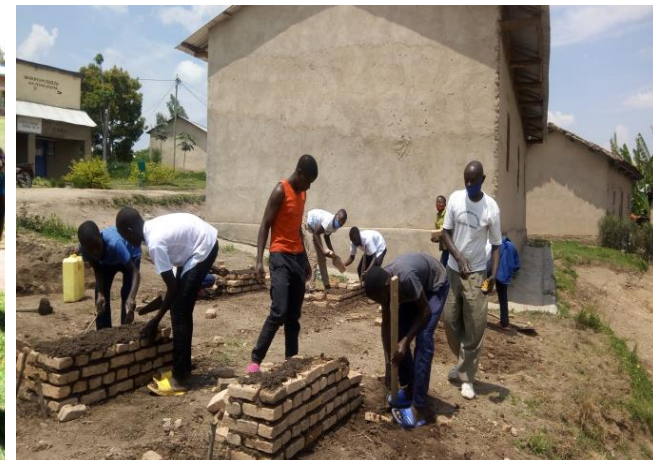
Les filles assistées par l'appui aux formations, et les garçons en section de maçonnerie