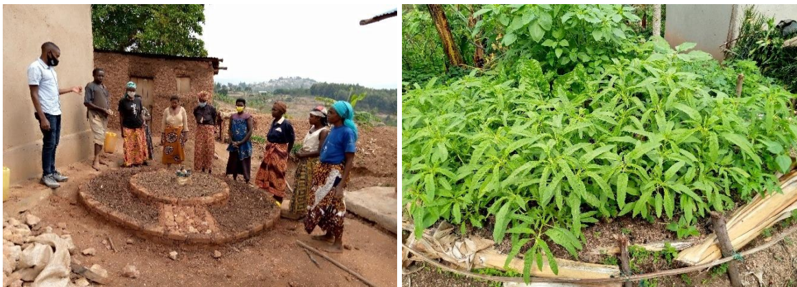
Photos de préparation d'un jardin potagers et celle des amarantes

Le projet a appuyé les bénéficiaires pour la mise en place de jardins potagers (avec amarante) pour chaque ménage, soit 59 bénéficiaires directs et 60 membres des groupes des imitateurs du projet LIVE. Cette activité a été réalisée dans l'optique de combattre la malnutrition sous toutes ses formes et d'augmenter les revenus monétaires des ménages encadrés.