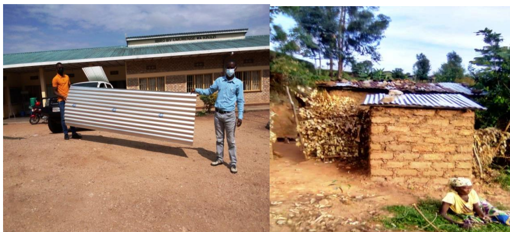
Photo de distribution au secteur et celle de latrine construite

Grâce à l'appui du jumelage à ce projet, nous avons pu acheter et distribuer à 68 familles 136 tôles d'une valeur de 1.029.000 Frw. C'est le Secteur qui distribue ces tôles juste après vérification de l'avancement des travaux préliminaires convenus avec la famille bénéficiaire.