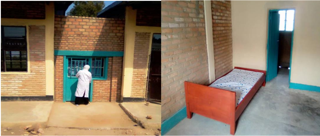
Local des jeunes filles à Kato