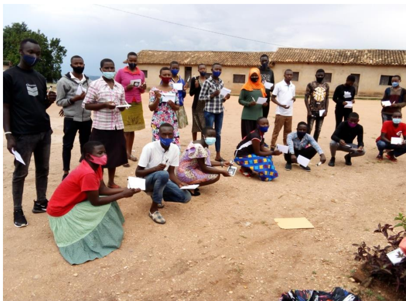
Photo des élèves parrainés