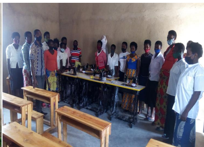
Visite du centre et visite de la classe de couture autour des machines financées par le jumelage