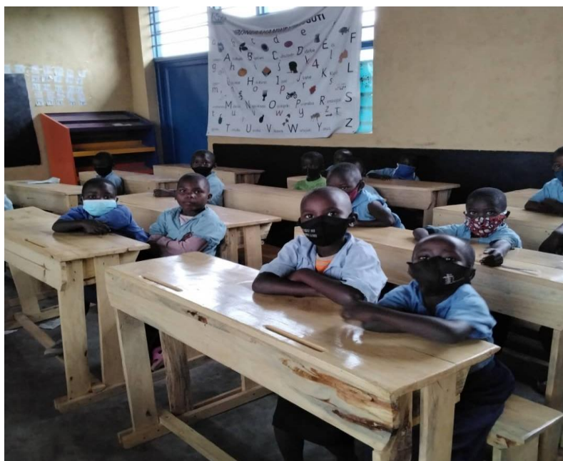
Les élèves de Gitovu sur les pupitres financés par le jumelage

C'est la raison pour laquelle la direction de l'école a présenté au comité de jumelage un projet d'équipement mobilier de cette nouvelle salle de classe comprenant 23 pupitres, 1 table et 1 chaise. Le jumelage a accordé à ce projet une aide financière de 750.000 Frw, ce qui a permis à l'école de s'équiper de 23 nouveaux pupitres pour 46 élèves. Ces écoliers ont trouvé des pupitres et ils poursuivent leurs leçons dans des conditions favorables.