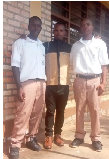
Visite aux élèves du GS St Phillippe Neri