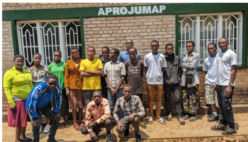
Les élèves parrainés par Ganshoren

Vingt un élèves (21) parrainés dans cette année scolaire 2025 ont eu des rencontres avec le chargé de suivi des activités de jumelages avant de commencer une nouvelle année scolaire 2025-2026. Au cours de cette réunion, les élèves ont reçu ensemble des instructions et des recommandations relatant les comportements qu'ils doivent opter à leurs écoles respectives, l'accent est mis sur la mobilisation des efforts de tout et chacun dans le but d'atteindre de bons résultats à l'école. Après avoir fait la réunion, ils ont remis leurs bulletins de fin d'année et chacun a rentré avec son bordereau de minerval du 1 er trimestre de l'année scolaire 25-2026.