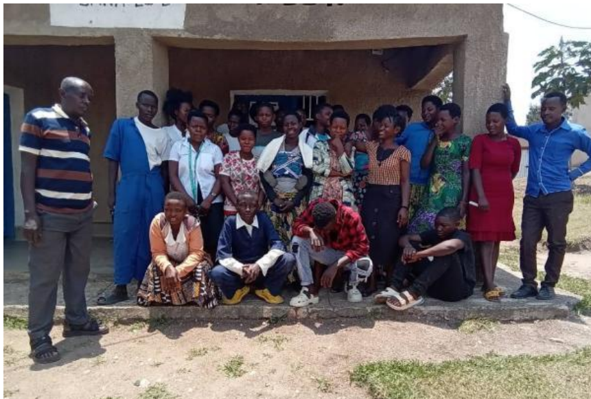
Les jeunes en formation au CFJ Nyarurama

Une visite au centre de formation des jeunes de Nyarurama a été effectuée tout au début du commencement de la formation. En général, tous les jeunes qui apprennent des formations de courte durée sont très intéressés par les soutiens moral et matériel reçus selon le choix de section préféré à chacun d'eux.