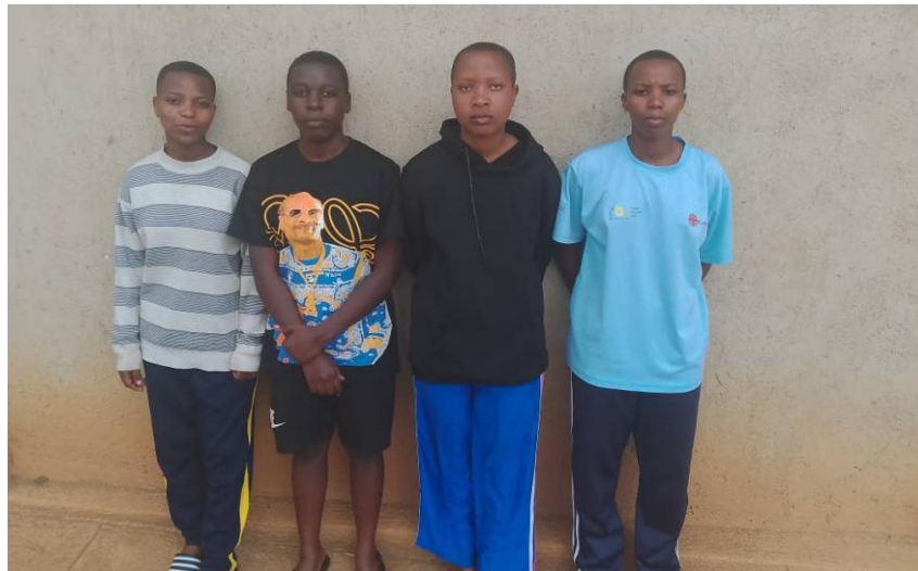
Les élèves de l'ES de Mutunda

Ces visites ont été faites à deux écoles abritant des enfants à l'internat entre autres l'ES de Mutunda et celle du GS Saint Philippe Neri de Gisagara. Quatre jeunes filles appuyés à l'ES de Mutunda sont très heureuses et toutes ont commencé leur année scolaire sans retard. Deux jeunes garçons qui étudient au Groupe Scolaire Saint Philippe Neri de Gisagara sont arrivés à l'école à temps malgré l'un de deux qui avait des difficultés familiales.