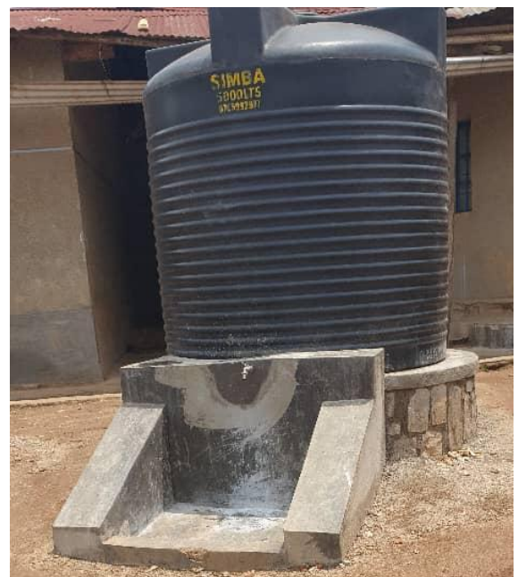
Les citernes données au Lycée de Rusatira