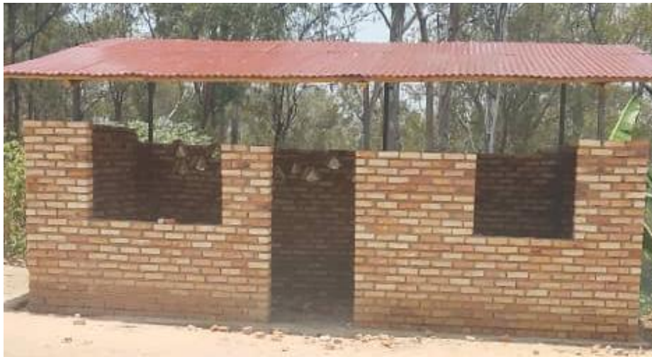
Une cuisine non achevée de la démonstration culinaire du C.S de Gitovu.

Visite et appui conseil à la construction de la cuisine au Centre de Santé de Gitovu, il nous a montré l'état d'avancement de la construction de la cuisine, nous avons partagé les difficultés rencontrées au moment de la mise en œuvre de cette infrastructure surtout difficulté liée à la hausse généralisée de prix de matériaux de construction ce qui a fait que le budget prévu et accordé leur a été très faible pour l'achèvement de cette cuisine. Il souhaiterait avoir un autre renfort dans les projets de l'année 2026 pour finaliser cette action. Appui à l'achèvement de cette cuisine est importante car au cours de l'année 2025 le centre de santé n'a pas pu l'achever alors que les mamans qui amènent les enfants en malnutrition en ont réellement besoin pour la démonstration culinaire et la préparation d'un repas équilibré pour leurs enfants, achever cette cuisine a une rôle incontournable pour la construction des bonnes personnes pour la future génération