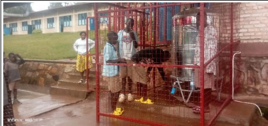
Water S.Tank de l'EP Remera

Dans le but de renforcer la capacité hygiénique et de lutter contre les maladies hydriques aux établissements scolaires, le GS Kotana et l'EP Remera ont été appuyés à l'accès à l'eau potable par l'obtention des citernes d'eau filtrée. Ces deux citernes sont toutes opérationnelles, les élèves sont très joyeux très content de consommer l'eau filtrée.